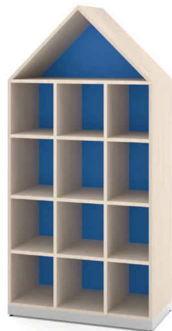
Escaninho Fun 12 Vãos L x A x P 90 x 140 x 45