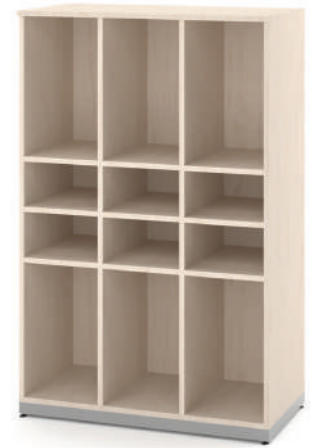
Mochileiro 6 Vãos com 6 porta-lancheiras L x A x P 90 x 180 x 45