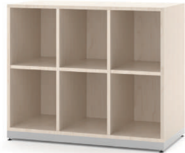
Escaninho 6 Vãos L x A x P 90 x 74 x 45