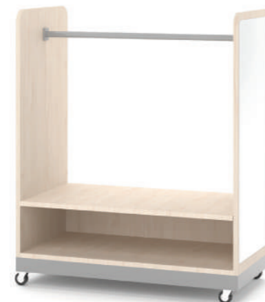
Armário Fantasia Móvel L x A x P 90 x 100 x 45