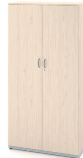
Armário Alto Fechado com 5 Prateleiras L x A x P 80 e 90 x 180 x 45