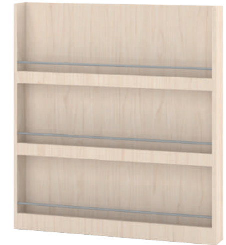
Estante Biblioteca Paredes L x A x P 90 x 100 x 11