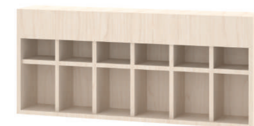
Armário Suporte de Fraldas L x A x P 120 x 50 x 22

Cores de personalização de porta disponíveis: