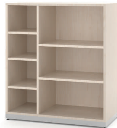
Escaninho 7 Vãos L x A x P 90 x 100 x 45