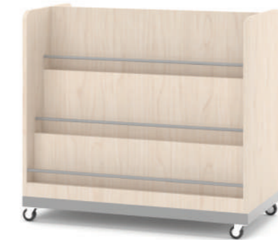
Armário Biblioteca Móvel L x A x P 90 x 74 x 45