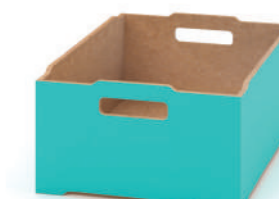
Caixa de Madeira Empilhável Extra Grande L x A x P 39 x 22,5 x 52,8