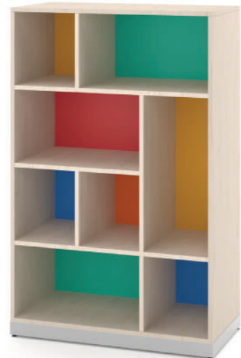
Escaninho Irregular Fun 8 Vãos L x A x P 90 x 140 x 45