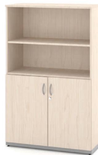
Armário Executivo Médio L x A x P 90 x 140 x 45