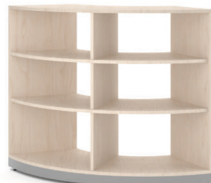
Armário Curvo 90 L x A x P 90 x 100 x 90