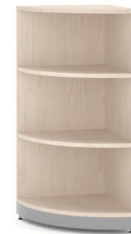
Armário de Canto Curvo L x A x P 90 x 100 x 90