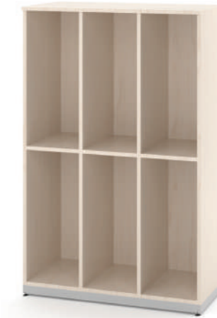
Mochileiro 6 Vãos L x A x P 90 x 140 x 45