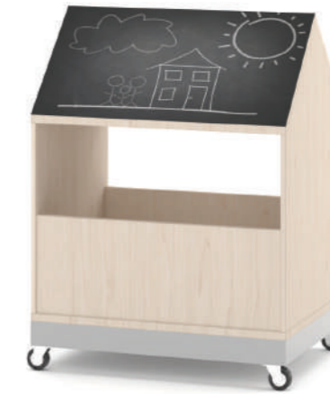
Armário Baú Móvel Fun L x A x P 80 x 100 x 45