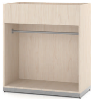
Armário Fantasia Baixo L x A x P 90 x 100 x 45