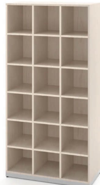
Escaninho 18 Vãos L x A x P 90 x 180 x 45