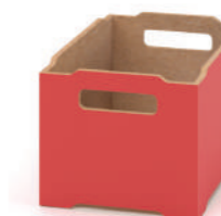
Caixa de Madeira Empilhável Grande L x A x P 26,5 x 22,5 x 39,5