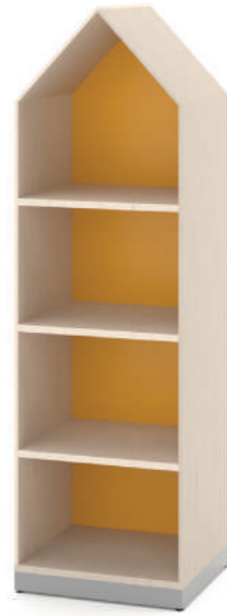
Armário Médio Fun L x A x P 50 x 140 x 45