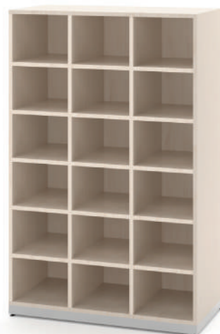
Escaninho 18 Vãos L x A x P 90 x 140 x 45