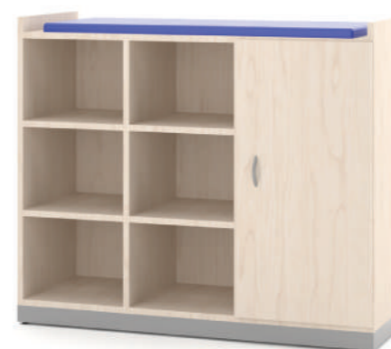
Trocador de Fralda L x A x P 120 x 100 x 60

Desenvolvido especialmente para oferecer maior praticidade e funcionalidade na hora de trocar os pequenos. Acompanha prateleiras e portas garantindo segurança no armazenamento.