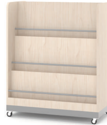
Armário Biblioteca Móvel L x A x P 90 x 100 x 45