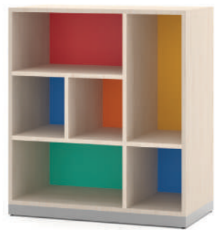
Escaninho Irregular Fun 6 Vãos L x A x P 90 x 100 x 45