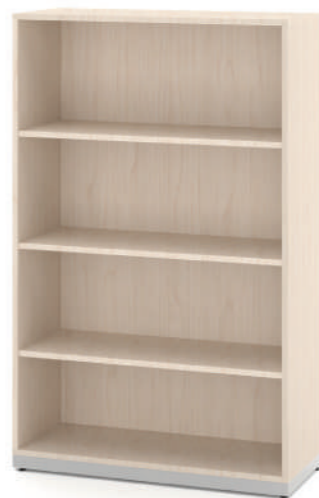
Estante Biblioteca Média com 3 prateleiras L x A x P 90 x 140 x 35