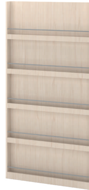
Estante Biblioteca Paredes L x A x P 90 x 180 x 11