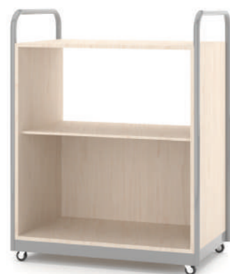
Carrinho Multimídia L x A x P 90 x 110 x 45

Acomoda todo o suporte de mídia em uma sala de aula, com rodízios e alças metálicas, que facilitam no manuseio do produto. Suas prateleiras e portas ajudam na organização e segurança no armazenamento de objetos.