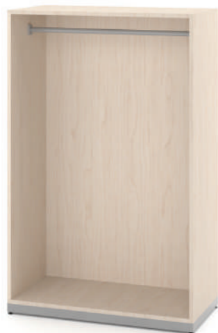
Armário Fantasia Médio L x A x P 90 x 140 x 45