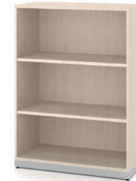
Armário Médio Aberto com 2 Prateleiras L x A x P 90 x 100 x 45