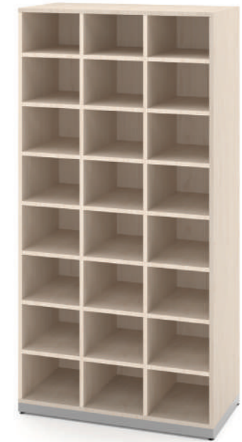
Escaninho 24 Vãos L x A x P 90 x 180 x 45