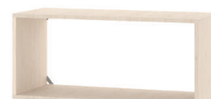
Nicho Médio L x A x P 90 x 40 x 37