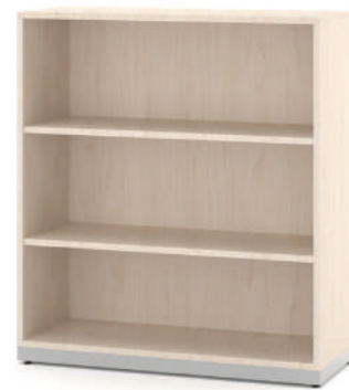
Estante Biblioteca Baixa com 2 prateleiras L x A x P 90 x 100 x 35