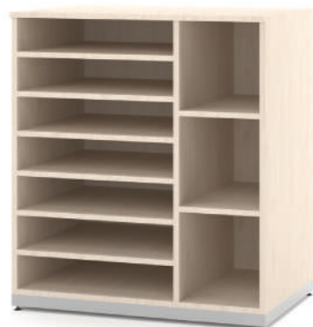
Armário Baixo Cartolina com 3 Nichos L x A x P 90 x 100 x 60