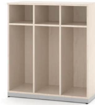
Mochileiro 3 Vãos com 3 porta-lancheiras L x A x P 90 x 100 x 45