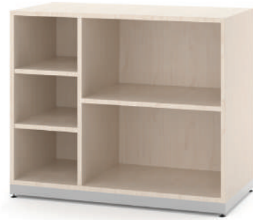
Escaninho 5 Vãos L x A x P 90 x 74 x 45