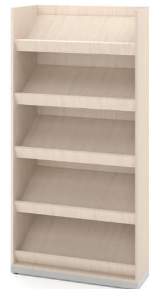
Revisteiro Alto com 5 expositores L x A x P 90 x 180 x 45