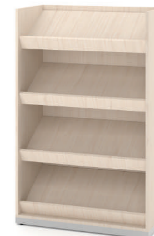
Revisteiro Médio com 4 expositores L x A x P 90 x 140 x 45