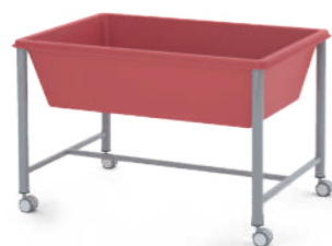
Tanque Sensorial 100L L x A x P 95 x 64 x 68