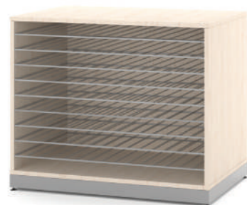
Estante Secagem 9 Prateleiras L x A x P 90 x 74 x 60

Ideal para secagem das artes das crianças. Suas prateleiras metálicas com corrediças telescópicas garantem a segurança no manuseio do produto.