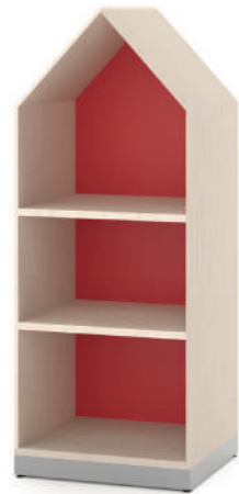
Armário Baixo Fun L x A x P 50 x 100 x 45