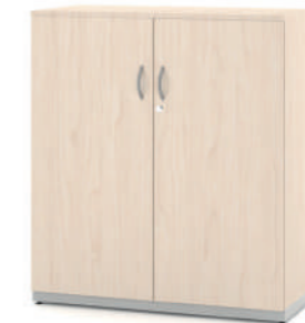
Armário Baixo Fechado 100 com 2 Prateleiras L x A x P 80 e 90 x 100 x 45