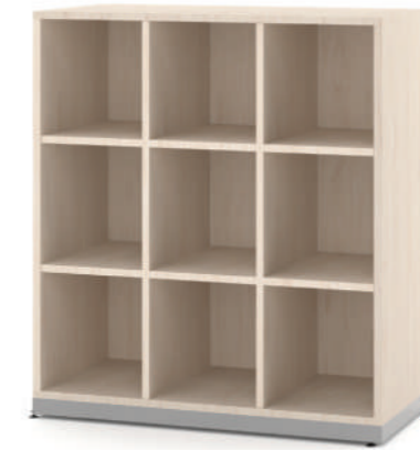
Escaninho 9 Vãos L x A x P 90 x 100 x 45