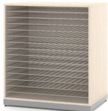
Estante Secagem 14 Prateleiras L x A x P 90 x 100 x 60