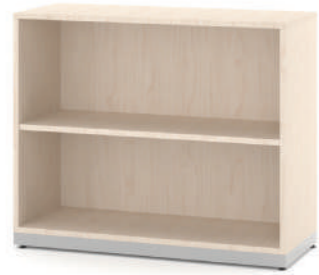
Estante Biblioteca Baixa com 1 prateleira L x A x P 90 x 74 x 35