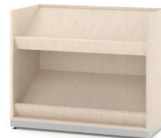
Revisteiro Baixo com 2 expositores L x A x P 90 x 74 x 45