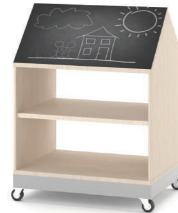
Armário Aberto Móvel Fun L x A x P 80 x 100 x 45