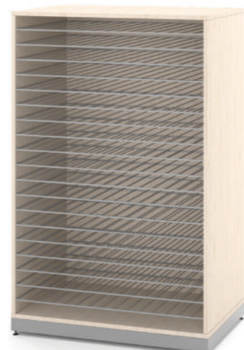
Estante Secagem 19 Prateleiras L x A x P 90 x 140 x 60