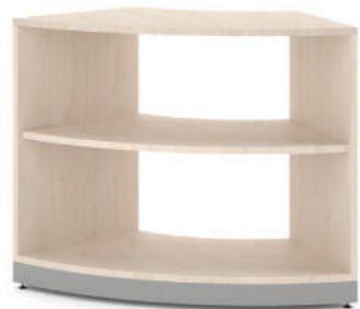
Armário Curvo 45 L x A x P 45 x 74 x 45