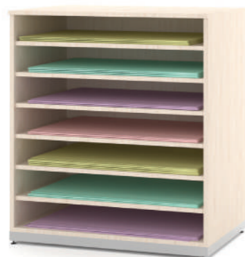
Armário Baixo Cartolina L x A x P 90 x 100 x 60

Possui prateleiras para proteger as cartolinas, sem amassar nem dobrar. Ideal para atividades pedagógicas que estimulam os alunos no desenvolvimento da criatividade.