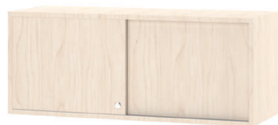
Armário Suspenso Fechado L x A x P 100, 120, 140, 160, 180 x 40 x 37