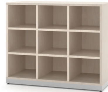
Escaninho 9 Vãos L x A x P 90 x 74 x 45