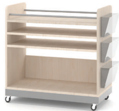
Armário Artes Móvel L x A x P 90 x 74 x 45