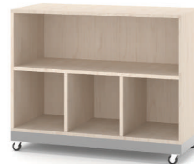
Armário Escaninho Móvel com Fundo L x A x P 90 x 74 x 45

Design prático e funcional. Com grandes possibilidades de composições.