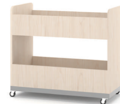
Armário Multiuso Móvel L x A x P 90 x 74 x 45