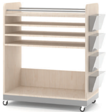
Armário Artes Móvel L x A x P 90 x 100 x 45