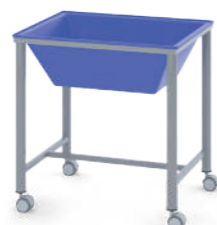
Tanque Sensorial 50L L x A x P 63 x 64 x 51