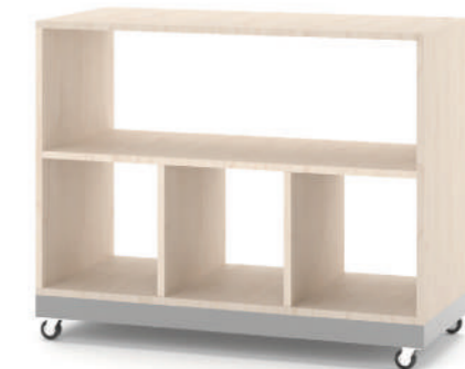
Armário Escaninho Móvel L x A x P 90 x 74 x 45