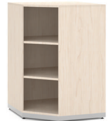
Armário de Canto Curvo L x A x P 70 x 100 x 70