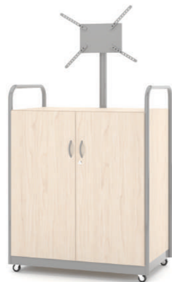
Carrinho Multimídia Fechado com Suporte para TV L x A x P 90 x 110 x 45