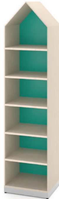
Armário Alto Fun L x A x P 50 x 180 x 45