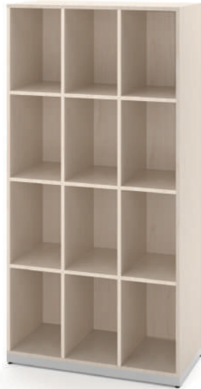
Escaninho 12 Vãos L x A x P 90 x 180 x 45