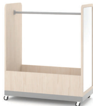
Armário Fantasia Móvel com Baú L x A x P 90 x 100 x 45