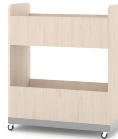
Armário Multiuso Móvel L x A x P 90 x 100 x 45