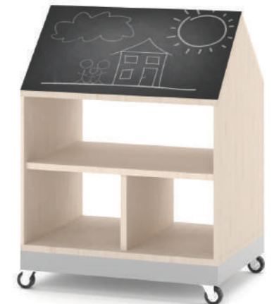
Armário Escaninho Móvel Fun L x A x P 80 x 100 x 45