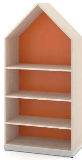
Armário Médio Fun L x A x P 90 x 140 x 45