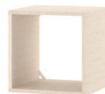
Nicho Pequeno L x A x P 40 x 40 x 37