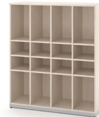
Mochileiro 8 Vãos com 8 porta-lancheiras L x A x P 120 x 140 x 45