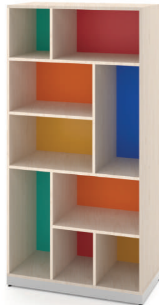
Escaninho Irregular Fun 9 Vãos L x A x P 90 x 180 x 45