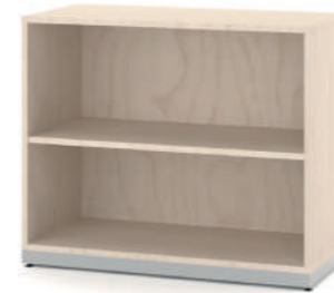
Armário Baixo Aberto com 1 Prateleira L x A x P 90 x 74 x 45