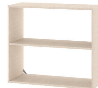
Nicho Grande L x A x P 90 x 80 x 37