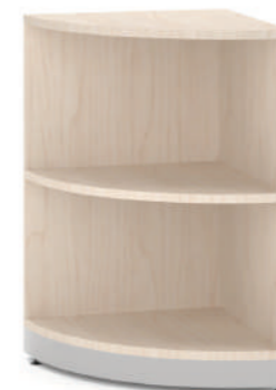
Armário de Canto Curvo L x A x P 90 x 74 x 90