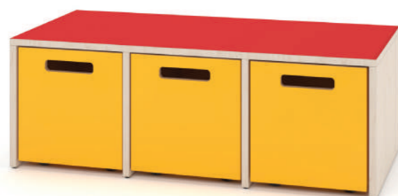
Banco Fun com 3 Divisórias L x A x P 100 x 35 x 45