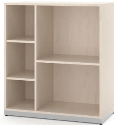
Escaninho 5 Vãos L x A x P 90 x 100 x 45