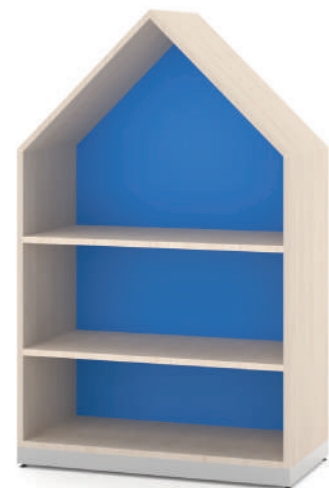
Armário Baixo Fun L x A x P 90 x 100 x 45