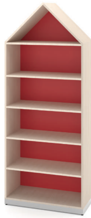
Armário Alto Fun L x A x P 90 x 180 x 45