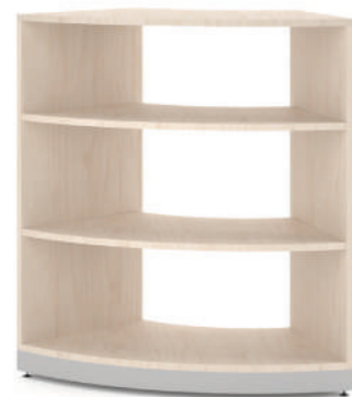
Armário Curvo 45 L x A x P 45 x 100 x 45