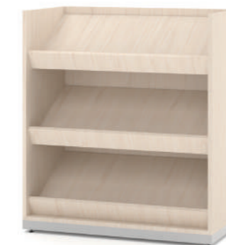
Revisteiro Baixo com 3 expositores L x A x P 90 x 100 x 45