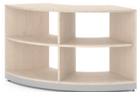
Armário Curvo 90 L x A x P 90 x 74 x 90