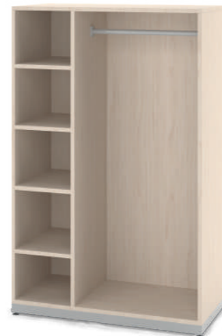
Armário Fantasia Médio com 5 Nichos L x A x P 90 x 140 x 45