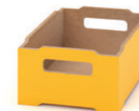
Caixa de Madeira Empilhável Média L x A x P 26,5 x 15 x 39,5