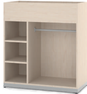
Armário Fantasia Baixo com 3 Nichos L x A x P 90 x 100 x 45