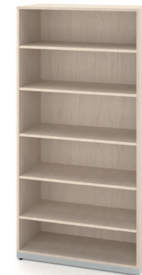
Armário Alto Aberto com 5 Prateleiras L x A x P 90 x 180 x 45