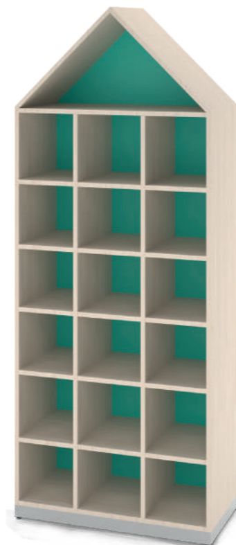
Escaninho Fun 18 Vãos L x A x P 90 x 180 x 45