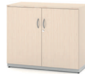
Armário Baixo Fechado com 1 Prateleira L x A x P 80 e 90 x 74 x 45