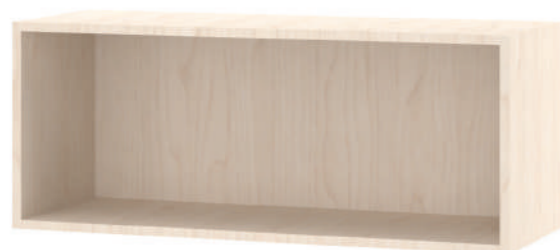
Armário Suspenso Aberto L x A x P 100, 120, 140, 160, 180 x 40 x 37