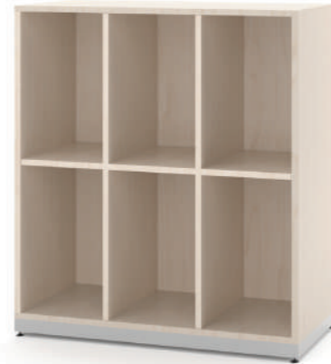
Escaninho 6 Vãos L x A x P 90 x 100 x 45