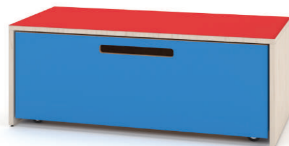
Banco Fun L x A x P 100 x 35 x 45